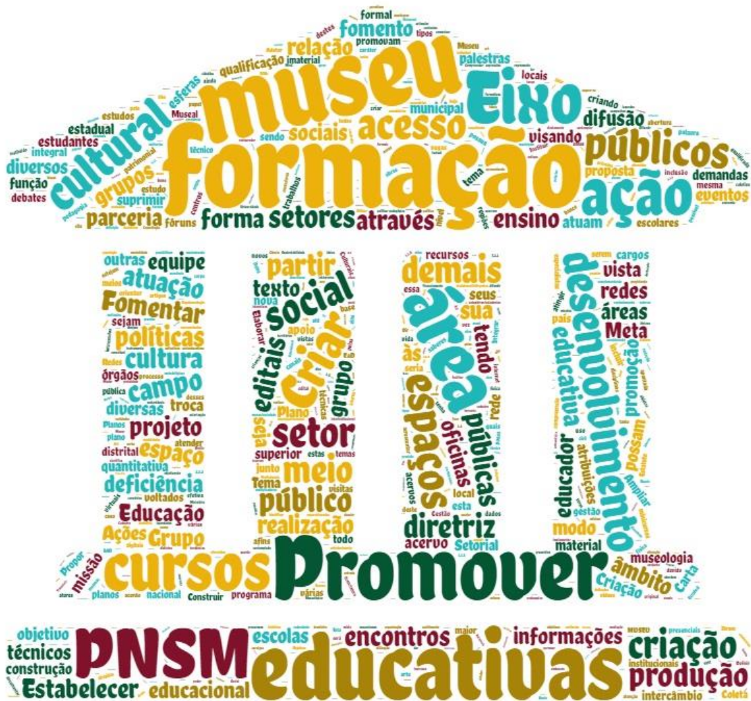
Nuvem de palavras das propostas desse documento. As maiores aparecem mais frequentemente.