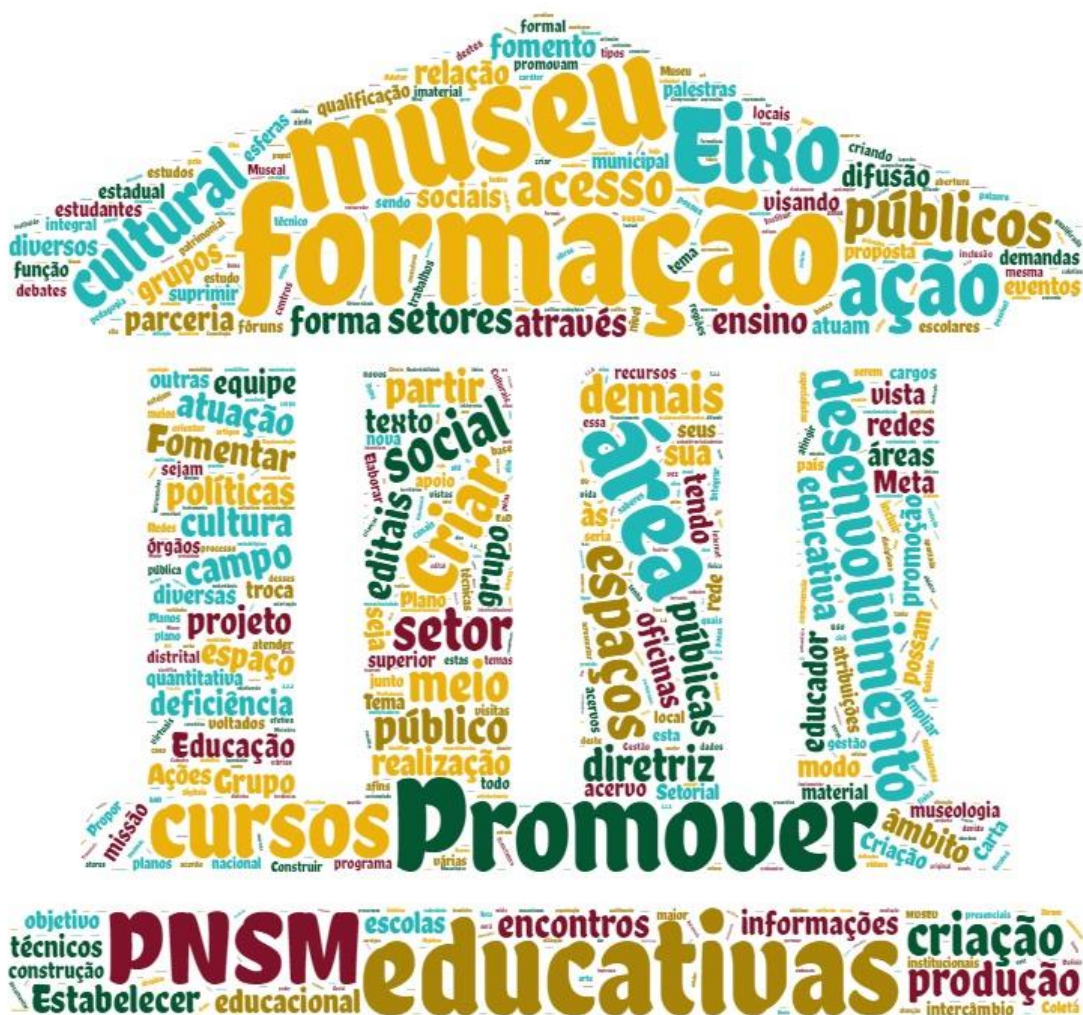
Nuvem de palavras das propostas desse documento. As maiores aparecem mais frequentemente.